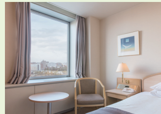
シングルルーム例